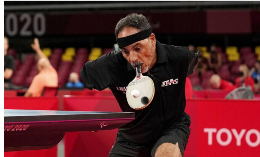
Επιτραπέζια αντισφαίριση (ping pong)