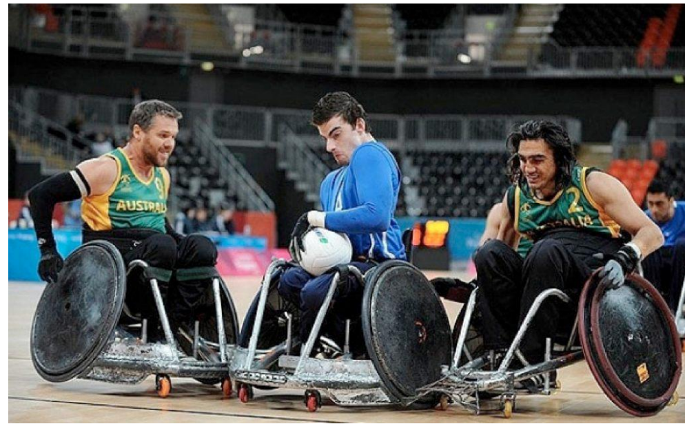
Ράγκμπι με αμαξίδιο (rugby)